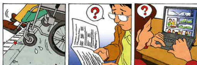
例 街なかの段差 3センチ程度の段差で車椅子は進めなくなります 例 書類 難しい漢字ばかりでは理解しづらい人もいます 例 ホームページ すべて画像だと読み上げソフトが機能しません