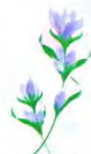
精神科救急情報センター りんどう