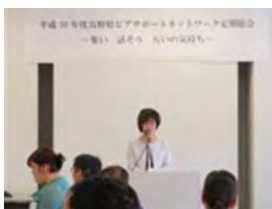
総会・交流会を終えて