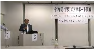
端田先生の講演会

ーか」「支援者か」の二分法ではなく、支援者を業とする者(自分も)の中にある「ピア性」は共感の要素になること、自己覚知の大切さもあらためて感じました。グループで話題になった自助グループのあり方、「多様性を受け入れる」と言うのは簡単ですが、現実には苦悩がつきまとう、しかしそこに向き合っていくことが、私たちの役割でもありますね。オープンダイアログで云う「不確実性への耐性」でしょうか。(60代・男性) * 先生のお話はとても興味深く日頃の支援にとっても参考になることばかりでした。特にバイステック原則です。再度、振り返ることにより、確認でき、改めて気づかされることも多々ありました。「感情を表出させる」難しいことですが実践していきたいです。「自分の感情を自覚し吟味する」も再確認できました。(50代・女性)